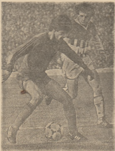
Clouă încearcă să „ghicească” fenta lui Lăcătuș. (Să-i urăm feroviarului o... rapidă revenire pe gazon)