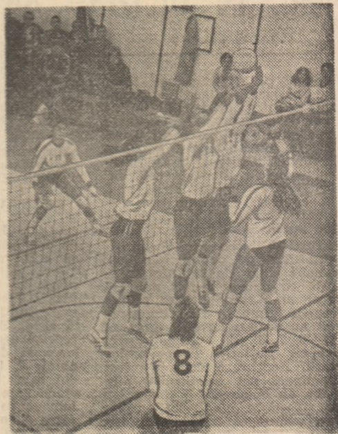
Blocajul dinamovistelor poate să redevină punctul forte al campioanelor