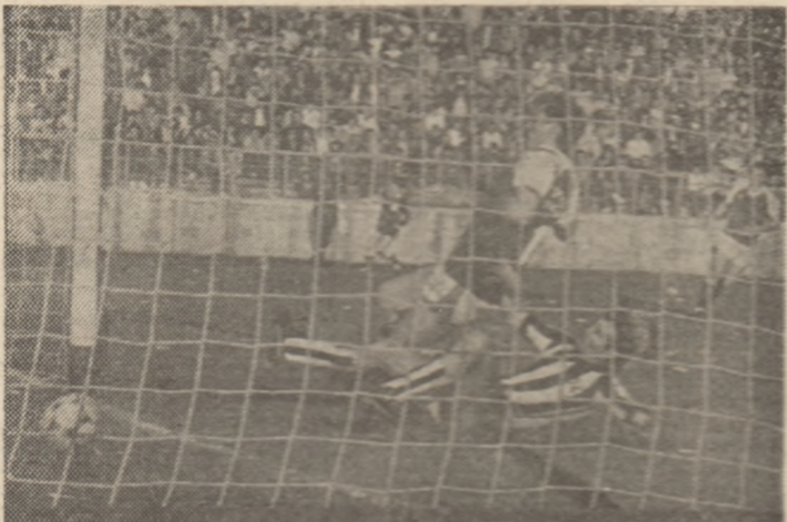
Suporterii Sportului respiră aprig: Coras (in picioare) bucurie golul doi!

● F.C. Olt reușește marea surpriză, învingind la Pitești ● F.C.M. Brașov obține primele puncte în deplasare ● Rapid cîștigă în min. 88! ● Miercuri, la Baia Mare, meci decisiv și pentru gazde și pentru... Sportul studentesc, dar derby-ul se numește Dinamo - Universitatea Craiova