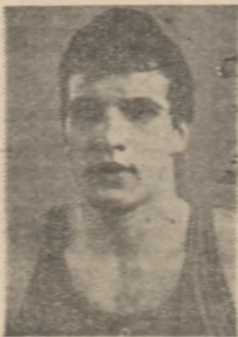
Vladimir Dolganov (U.R.S.S.)