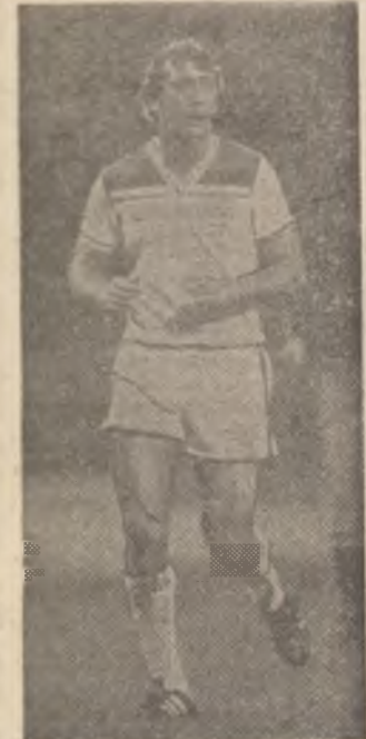
Fotbalistul Trevor Francis, în formă excelentă, posibil titular al Angliei pentru meciul cu România (București, 1 mai)

Iată meciurile din turul al doilea al „Cupei Africii” (de fapt un campionat al acestui continent). Pentru turul al doilea au fost programate jocurile: Zimbabwe - Senegal, Maroc - Zair, Kenya - Algeria, Coasta de Fildeș - Ghana, Nigeria - Zambia și Libia cu învingătoarea dintre Malawi și Mozambic. Învingătoarele acestor partide vor participa la turneul final, programat între 7-21 martie 1986, în Egipt. Pentru această ultimă fază sînt calificate direct Egipt (tara organizatoare) și Camerun (deținătoarea titlului).