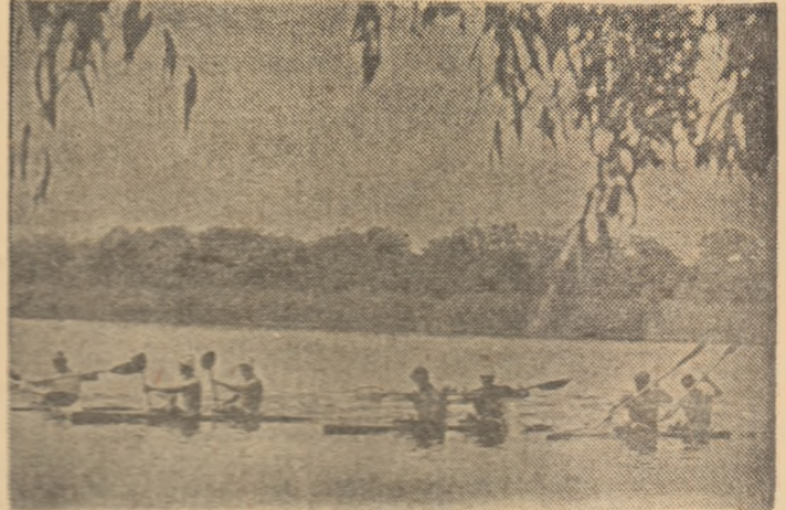
Începînd de miine, timp de două zile, apele lacului Snagov vor cunoaște din nou animația disputelor sportive: Campionatele republicane de fond la caiac-canoe vor deschide sezonul '85 pentru aceste sporturi.

Programul campionatului, în cele două zile, prevede startul primei ambarcații la ora 9, cursele de caiac băieți 1, 2 și 4 desfășurindu-se pe distanța de 10 000 m, iar cele ale fetelor — K 1, 2 și 4 — pe distanța de 5 000 m. Concurrenții de la canoe se vor întrece, la simplu și dublu, pe distanța de 10 000 m. (A.L. S.J)