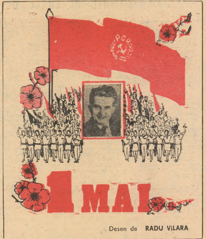
Desen de RADU VILARA

Sărbătorind acum, din nou, ea de fiecare dată, cu sentimente de profundă bucurie, cu frumoase realizări în toate sferile de activitate, ziua de 1 Mai, oamenii muncii din țara noastră, indiferent de naționalitate, își manifestă și cu acest prilej dragostea fierbinte și recunoștința față de conducătorul partidului și statului nostru, tovarășul Nicolae Ceaușescu, unitatea trainică, de nezdrunclnat în jurul partidului, al secretarului său general, hotărîrea fermă de a înfăptui cu abnegație obiectivele stabilite de Congresul al XIII-lea, pentru a asigura astfel ridicarea necontenită a României socialiste pe noi culmi de progres și civilizație.