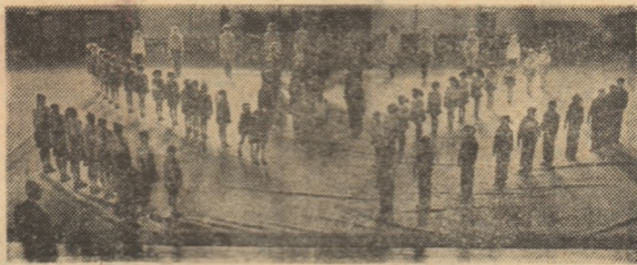
Între acțiunile sportive dedicate Anului Internațional al Tineretului s-a înscris și cea mișcată și organizată de Clubul sportiv școlar „Triumf“ din Capușă în sala de sport a Institutului agronomic...

În suta amplexelor acțiuni inițiate în întreaga țară și dedicate Zilei Muncii și Zilei Tineretului, sportului — activitate larg îndrăgită de cetățenii patriei de toate vârstele — i s-a rezervat și în acest an un loc aparte. Astfel, în zilele de 1 și 2 mai, pe terenurile și bazele sportive ale asociațiilor și cluburilor au fost programate numeroase și atractive întreceri sportive.