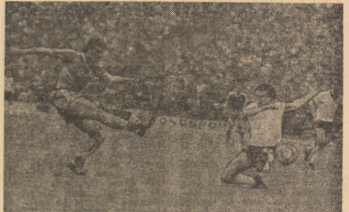
Cămătaru sau copen... golului de la Stockholm, cu o diferență de cîțiva centimetri

Echipa României a jucat mai mult fotbal, a avut un registru mai bogat. Ea a manifestat și o frumoasă prospețime, în nofida faptului că a avut des-