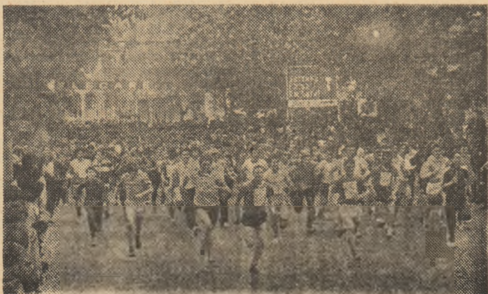
Start în marșul cros organizat în cadrul manifestărilor sportive dedicate Anului Internațional al Tineretului.