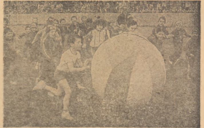
O secvență de la „Festivalul primăverii”

nivelul acțiunilor sportive de masă. Deschis printr-o înedită alegorie de box, lupte, scrimă, rugby, baschet, fotbal, volei etc., „Festivalul primăverii” și-a sporit continuu gradul de