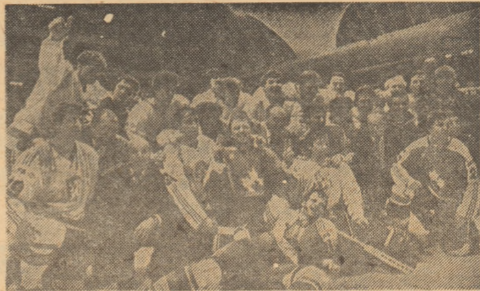
Echipele Cehoslovaciei și Canadei, după finală

● Canada n-a putut egala nici cu... 6 atacanți!