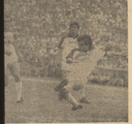
dar rapidiștii nu par îngrijorați...