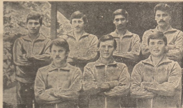
Tinerii noștri popicari medaliați cu bronz

Și băieții noștri și-au confirmat valoarea, ei angajându-se