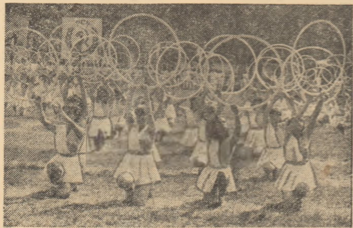
Pe scenă, cel mai expresiv și sincron ansamblu care a evoluat ieri dimineață pe „Tineretului”

Intîlnirea feminină de gimnastică România — Cehoslovacia