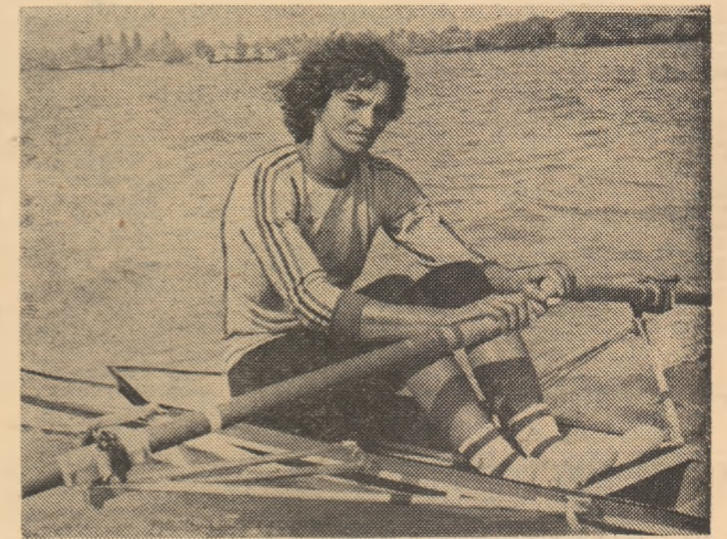
Valeria Răcilă — mereu în prim-planul curselor de simplu

mon indeosebi, vor putea vedea evoluind, așadar, pe Valeria Răcilă, „numărul 1” în ierarhia schifului mondial, pe celelalte medaliate cu aur pe lacul Casitas: Elena Florea, Rodica Arba (la 2 rame), Olga Bularda, Maria Fricioiu, Chira Apostol, Florica Lavric, Florica Ioja (la 4 + 1 rame) ș.a.