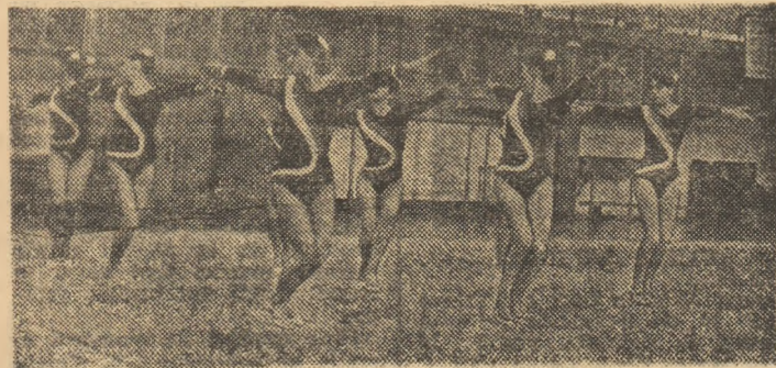
Evoluază reprezentativa Bucureștiului

disciplină, dar și capacitatea, forța de muncă și priceperea antrenorului Radu Constantin, ajutat în conceperea exercițiilor de Gina Stoenescu. De altfel, el a realizat o performanță remarcabilă: într-o săptămîină a cîștigat 3 competiții