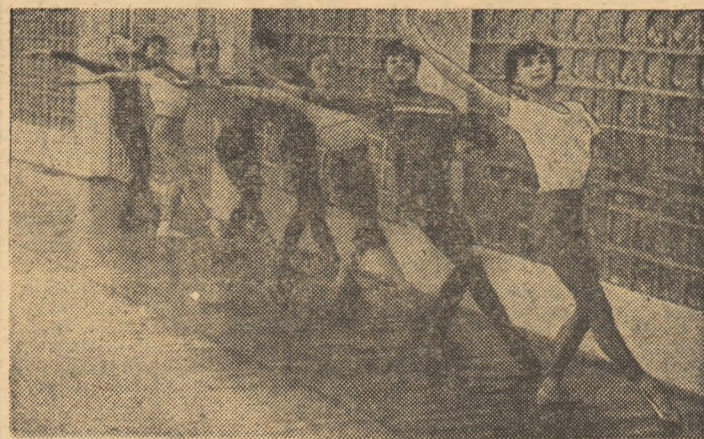
Componentele lotului în plin efort...