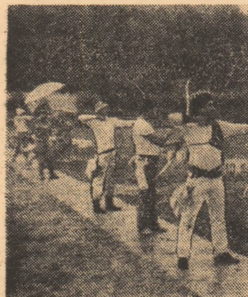
Eforturi pe linia de tragere, mușchi fără încetare, pe poligonul Tunari

Cine se scoală de dimineață... le poate vedea și pe