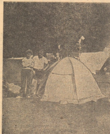
Cortul semisferic și inventatorul său

Acesta a fost începutul. A urmat cortul oval „Alina”, pentru șase persoane, cu lungimea interioară de 5 m și lățimea de 2 m, cu spații și amenajări pentru alimente și bagaje. Și iar surpriză: el se demontează în trei părți și cântărește doar 5 kg., putând fi transportat, astfel, cu mare ușurință de