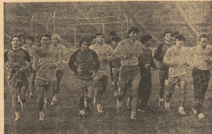
Ieri, la stadionul „23 August“ din Capitală, „tricolorii“ noștri într-o ușoară alergare

L-am rugat pe Mircea Lucescu să facă aprecieri asupra lotului convocată. (Lotul lărgit,