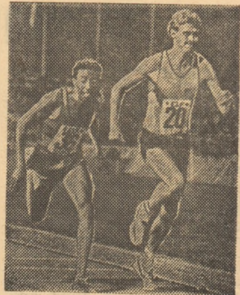
Steve Cram câștigă la limită în fața lui Said Aouita — ambii sub recordul lumii

NISA. Nici n-a apucat să se stingă ecourile excepționalului record al sovieticului Serghei Bubka, cu al său 6 metri la săritura cu prăjina și iată că un alt atlet (de fapt, este vorba de mai mulți) a ajuns în prim-planul actualității sportive, cu un record mondial de excepție. Marți, la NISA, în cadrul unui concurs continuu pentru „Marele premiu I.A.A.F.-Mobil”, în cursa de 1500 m a fost doborâtă bariera celor 3:30,0! La capătul unei dispute extraordinare, englezul Steve Cram (născut la Gateshead,