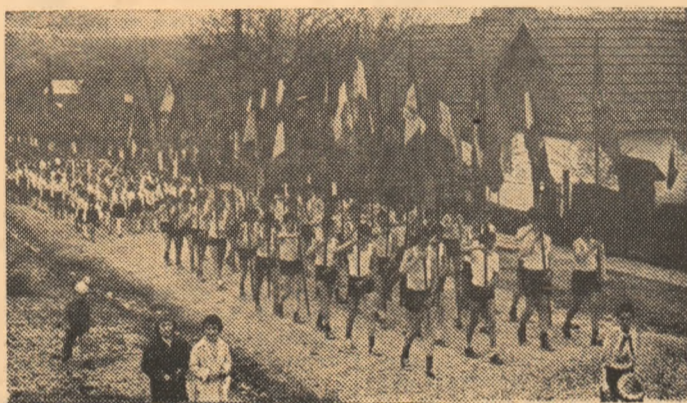
Tinerii din Suplacu de Barcău străbat comuna, in drum spre frumosul teren pe care își vor disputa cu ardore locurile fruntașe in întrecerile sportive

GAZDE — PETROLIȘTII DIN SUPLACU DE BARCĂU. O competiție sportivă de masă cu prestigiu in județ este „Festivalul sportiv al petrochimicilor“ organizat la Suplacu de Barcău, ajuns in acest an la cea de a șasea ediție. Este organizat anual, la 12—14 discipline (atletism, baschet, handbal, popice, orientare turistică, ciclism, fotbal ș.a.), participanții fiind muncitorii și muncitoarele din sectorul petrochimic (rafinării, schele de foraj), dar și din alte întreprinderi, instituții și școli din județ. In ediția '85 au fost circa 50 de cicliști (cursa a avut loc, pe diferite tipuri de biciclete — 50 km),