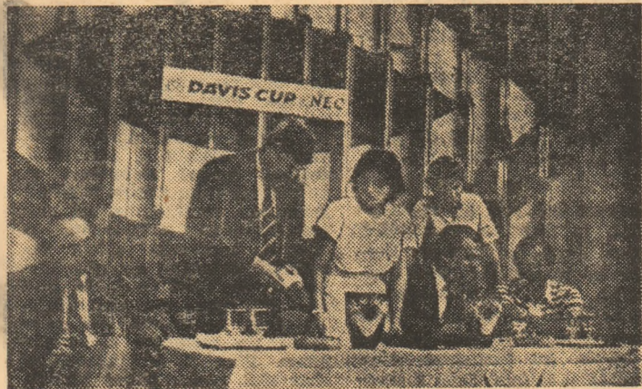
Aspect din timpul solemnității de ieri a tragerii la sorți