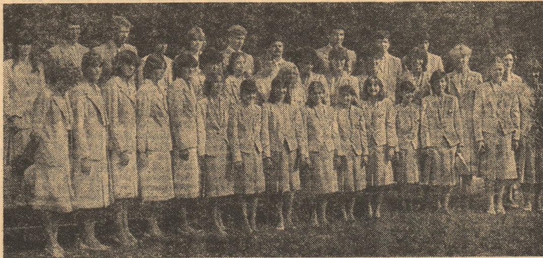
Grupul sportivilor români care au contribuit la cucerirea celor 20 de medalii de aur la Jocurile Olimpice din 1954

● De la Helsinki, în 1952, în arena disputelor olimpice sportivii români încep să și spună cuvîntul cu tot mai multă hotărîre, ei figurînd, de multe ori, la tot mai multe discipline, printre fruntași. Anul trecut, de exemplu, din 140 de țări participante la ediția a XXIII-a, reprezentanții României socialiste, cu cele 20 de