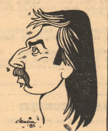
Majaru văzut de Clenciu

...echipa timișoreană Chinezul a reușit să cîștige titlul de șase ori consecutiv, un adevărat record al fotbalului nostru? Dar asta-i cam de multșor, performanța fiind realizată cu mai bine de șase decenii în urmă. În epoca modernă a fotbalului nostru doar Dina-