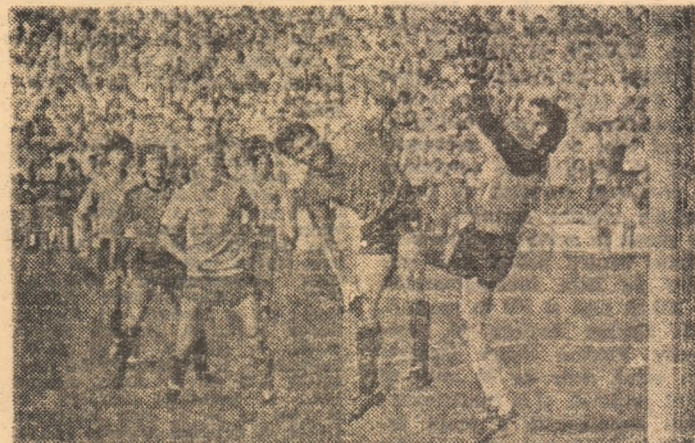
Ioniță respinge atacul lui Balint (Steaua — Corvinul 1-0)