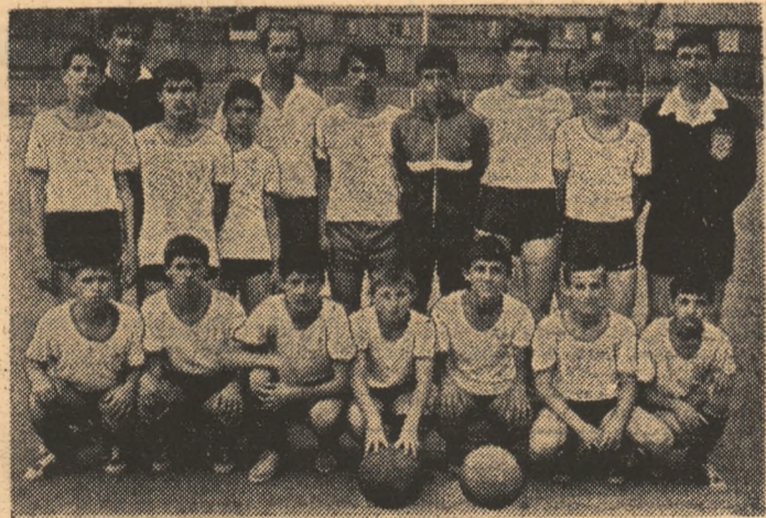
Cîștigătoarea ediției 1985 a „Cupei Pionierul” la fotbal, echipa Școlii generale din Tg. Cărbuneshi-Gorj