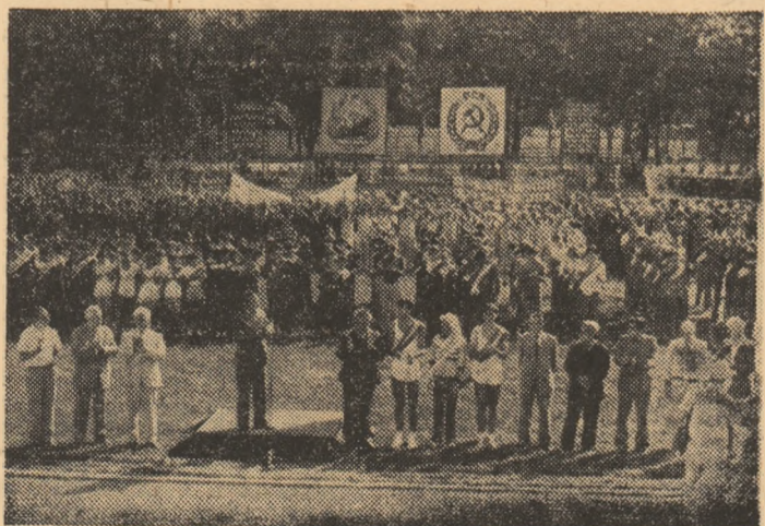
Manifestare entuziastă la deschiderea Adunării sportivilor, pe stadionul Tineretului din Capitală, cu prilejul sesirii „Ștafetei Păcii”

Da, sportivii noștri, întregul tineret român, toți ceilalți cetățeni care li s-au alăturat la