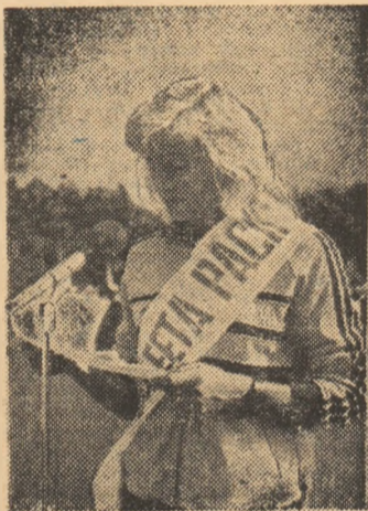
Campioana olimpică Maricica Puică citind „Apelul pentru pace” adresat de tineretul sportiv al României socialiste sportivilor din întreaga lume

Frumoașă și emoționantă această nouă manifestare încheind, într-o atmosferă însuflețitoare, entuziastă, sărbătorească, marea acțiune a tineretului