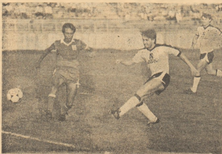
Golgeterul Hagii se respectă și în această fază, marcînd al pa-trulea gol pentru echipa sa.

În final, citeva cuvinte des-pre Rapid, căreia, după usturătorul esec suferit cu puține zile în urmă la Hunedoara, nu i-a fost lesne să surmonteze — în afară de „obstacolul Gloria” — și handicapul moral al „tri-bunelor” supărate de proas-