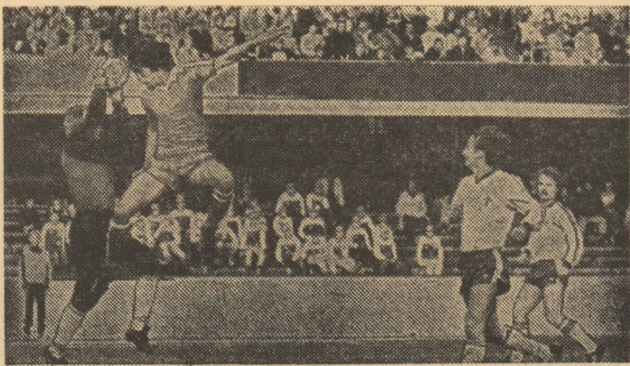
Ultimele minute ale jocului de la Helsinki au văzut echipa României în atac. Se așteaptă o și mai mare intensificare a ofensivei, la Timișoara.

Acum, în preajma noilor bătălii pentru calificare, fotbaliiștii români nu mai au de partea lor doar elanul celor de la Guadalajara, care