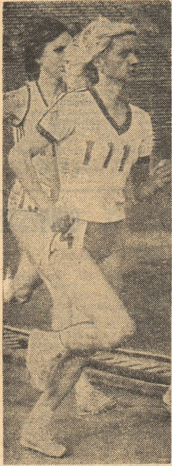
Miercuri, la Zurich, Maricica Puică și-a corectat cea mai bună performanță în proba de o milă, înregistrînd un nou record european

În 1975, cînd Nadia Comăneci cucerea la Skien primul său titlu de campioană absolută a Europei, lumea sportivă și-a dat seama că se afla în fața unui talent de excepție. Performanțele ulterioare repurtate de inegalabila noastră campioană aveau să confirme într-un totul marile ei posibilități de a-și etala cu virtuozitate fără seamăn înalta-i măiestrie: triplă campioană olimpică la J.O. de la Montreal, din 1976, dublă campioană olimpică la J.O. de la Moscova, din 1980, campioană mondială în 1978 și 1979, campioană absolută a Europei în 1977 și 1979 — iată doar o parte dintre strălucirile ei succese. Pe bună dreptate, Nadia este socotită ca una dintre cele mai mari gimnaste ale lumii.