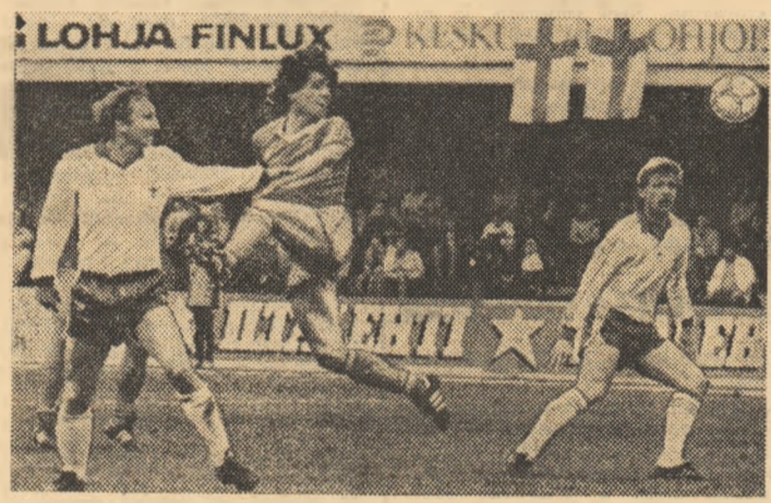
Hagi între doi adversari, în partida de la Helsinki, reușește să centreze balonul. Îl dorim la fel de activ și azi, la Timișoara

se vor derula la Londra (11 septembrie), București (18 octombrie, cu Irlanda de Nord) și Ankara (14 noiembrie). Pe acest traseu, pe care tricolorii trebuie să realizeze un punctaj cât mai bogat, primul parte-