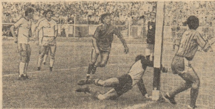
Min. 43, Dinamo majorează scorul din confruntarea Rednic — Movilă : 2-0

● „Europenele” — 7 puncte din opt. ● F.C. Argeș — prima victorie acasă în minutul... 90 ! ● Rapid a „uitat” de Corvinul : 4-0 cu F.C. Bihor. ● Hunedorenii (4-0), lideri ai eficacității ● Victoria — punct mare la Ploiești