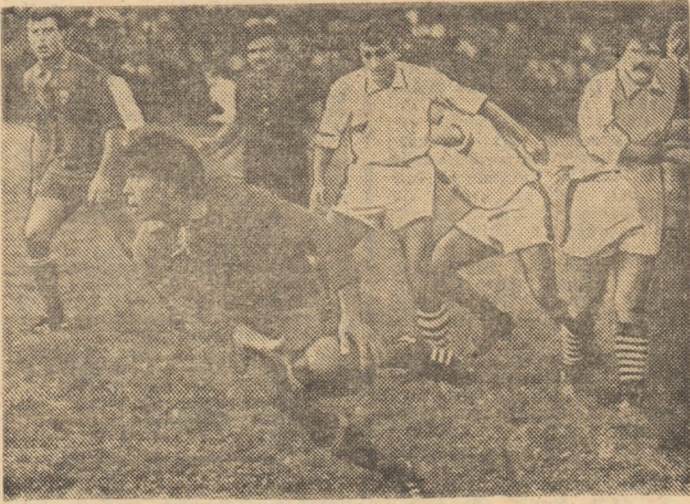
Grivițenii au câștigat duelul înaintărilor, Anton își deschide „treisferturile”...

Simbătă și duminică s-au disputat partidele celei de a cincea etape în Divizia „A” de rugby (etapa a șasea are loc la 27 octombrie, după meciul România — U.R.S.S., din 20 octombrie). Amănunte de la cele zece jocuri: