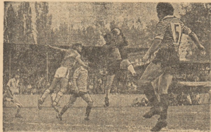
Cavai reține cu siguranță mingea spre care „zbură” Ursu.