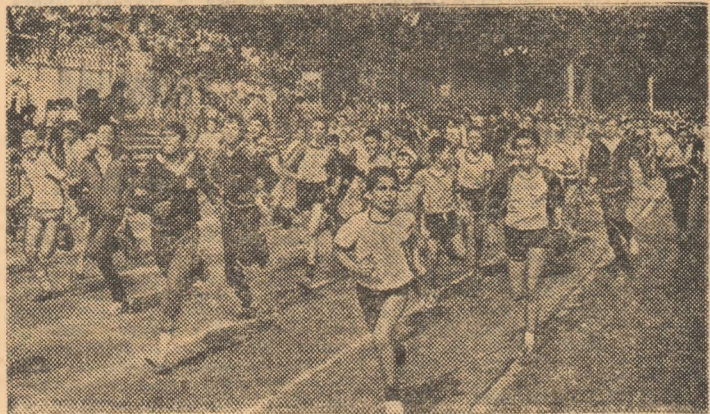
Start în crosul băieților de 11-12 ani...

modul exemplar în care a fost organizată de Consiliul municipal pentru educație fizică și sport, Comitetul municipal al