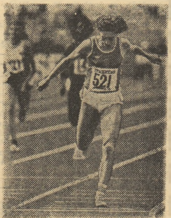
Marita Koch câștigă detașat cursa de 400 m la Canberra.

171 cm și 60 kg. Este studentă la medicină, la pediatrie. Antrenor: Wolfgang Meier, la clubul Empor din Rostock. Cariera ei pe scurt: 1972 (15 ani): 100 m — 12,2; 400 m — 60,3; 1973: 100 m — 12,1; 200 m — 24,5; 1974: 100 m — 11,8; 200 m — 24,2; 400 m — 55,5; 1975: 100 m — 11,7; 200 m — 23,92; 400 m — 51,60. Campioană europeană de junioare la 400 m (51,60); 1976: 100 m — 11,42; 200 m — 22,70; 400 m: 50,19. Fiind bolnavă a avut o evoluție modestă la J.O. de la Montreal: 1977: 100 m — 11,28; 200 m — 22,38; 400 m — 49,53. C.E. de sală la 400 m (51,14), câștigătoare a „Cupei Europei” 400 m (49,53), locul II în „Cupa mondială” la 400 m (49,76); 1978: 100 m — 11,16; 200 m — 22,06 (rec. mondial), 400 m — 49,19, 49,03 și 48,94 (recorduri mondiale). C.E. la 400 m (48,94); 1979: 100 m — 11,12; 200 m — 22,02 și 21,71 (rec. mondial); 400 m: 48,89 și 48,60 (rec. mondial). Universiadă — I la 200 m (21,91), „Cupa Europei” — I la 400 m (48,60), „Cupa mondială” — I la 400 m (48,97) și II la 200 m (22,02); 1980: 100 m — 10,99; 200 m — 22,34; 400 m — 48,88. Campioană olimpică la 400 m (48,88); 1981: 100 m — 11,16; 400 m — 48,27. „Cupa Europei” — I la 400 m (49,43), „Cupa mondială” — II la 400 m (49,27); 1982: 100 m — 11,13; 200 m — 21,71; 400 m — 48,16 (rec. mondial). C.E. — I la 400 m (48,16); 1983: 100 m — 10,83; 200 m — 21,82. Campioanele mondiale — II la 100 m (11,02), I la 200 m (22,13) și I la