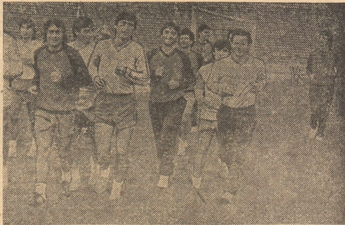
„Tricolorii”, din nou, pe stadionul „23 August”

● Meciul va fi transmis la posturile de radio și televiziune