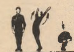
P.I. 1-2 3-4

Poziția inițială — depărtat stînd. Legănarea brațelor prin lateral sus (pe vîrfuri cu inspirație). Revenire înercișată prin față a brațelor (pe talpă cu expirație).