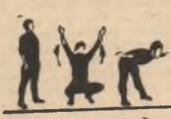
P.I. 1 2-3