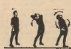
P.I. 1-2 3