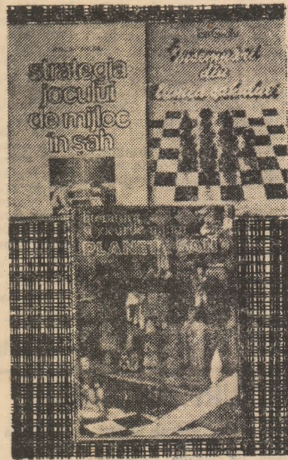
toilelor incluse), emese în gazetar Uli Valureanu, merită sincere felicitări.

În sfîrșit, ajungem la a treia lucrare din seria menționată, subliniind că este vorba de o realizare prestigioasă „Planeta șah”, în viziunea sa estivală, almanah al Uniunii Scriitorilor, se prezintă în condiții grafice și de conținut superioare, este captivantă. Coordonatorul (și autor al majorității capitolelor)