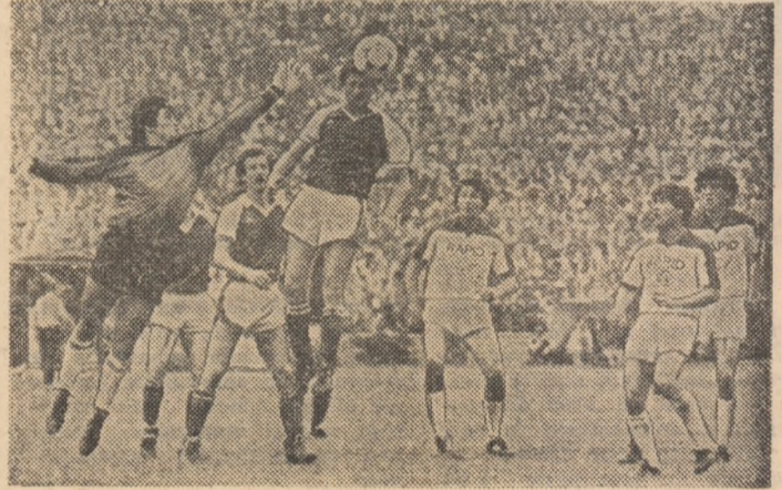
Fază din ultimul joc de campionat dintre Sportul studențesc și Rapid, încheiat la egalitate, 2-2. În prim-plan, Șerbănică respinge un atac feroviar.