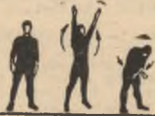
P.I. 1-2 3-4