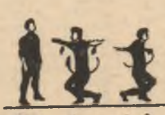
P.I. 1 2-3