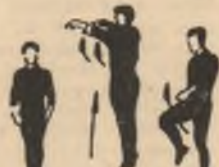
P.I. 1-2 3-4