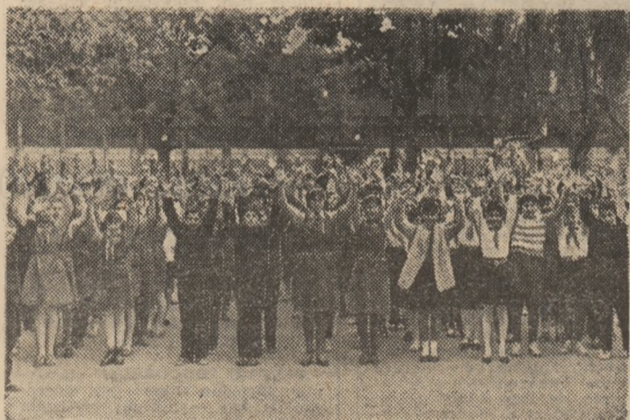
Pe fundalul unei frumoase zile de toamnă, o „repriză” de gimnastică de învioreare...

Revăd Școala nr. 174 din sectorul 6 al Capitalei după aproape un sfert de veac... Pe atunci învățau acolo mai puțin de 700 de copii, astăzi numărul lor se apropie de 3000. Cifra impresionantă, care implică prezența zi-lumină a învățătorilor și profesorilor (91) în trei schimburi. Ca într-o mare întreprindere!