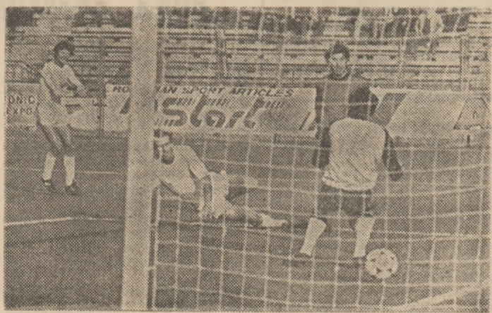
Mingea reluată de Pițurcă (tricou de culoare închisă), în secunda 49-a a jocului, se odihnește în plasă. (Cronica meciului Steaua — Politehnica Timișoara, în pag. 2-3)