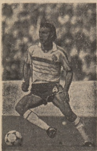
Patrick Battiston unul dintre cei mai buni jucători ai echipei Franței