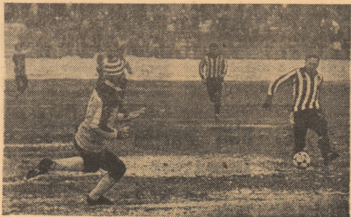
Așa a marcat Bozeșan golul victoriei