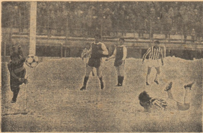
Goanță ratează o mare ocazie a echipei feroviare, trimișind mingea, cu capul, pe lîngă poartă.