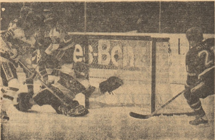
Fazele fierbinți au început în hocheiul internațional: imaginea prezintă un exemplu de la partida amicală Elveția - Cehoslovacia (scor final: 2-9)

U.R.S.S. (meciuri restante): Kutaisi - Harkov 4-1, Dinamo Tbilisi - Dinamo Kiev 2-1, Erevan - Dinamo Moscova 1-1, Baku - Donețk 0-0, Cernomoretș - Torpedo 3-2, Zenit - Vilnius 3-1, Dniepr - Alma Ata 4-3, Spartak - Dinamo Minsk 3-0. Pe primele locuri: Dinamo Kiev 48 p, Spartak 44 p, Dniepr 42 p.