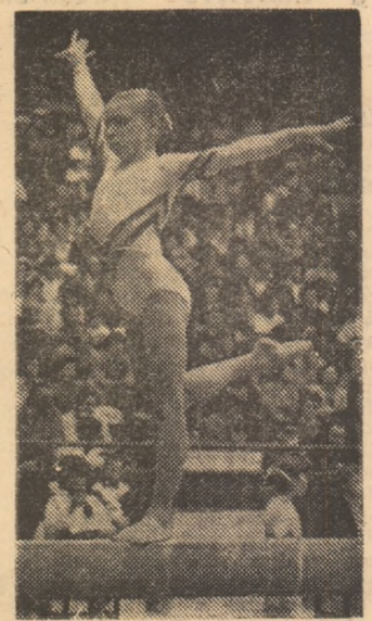
Evoluează pe birnă campioana mondială a probei, gimnasta română Daniela Silivaș