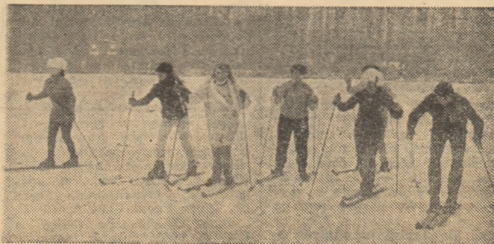
Prima zăpadă, primele concursuri de schi în Capitală organizate pe stadionul Voința, cu prilejul deschiderii etapei de iarnă a „Daciadei” pentru oamenii muncii din cooperarea meșteșugărească

La Budapesta, în prima manșă a finalei „Cupei cupelor” la polo