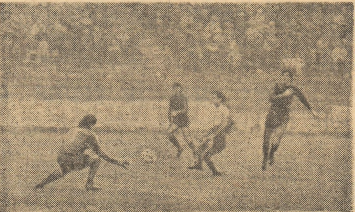
Min. 14: Iovan (primul din dr-apta) înscrie golul doi al echipei campioane. (Fază din partida Steaua - F.C.M. Brașov 6-0)