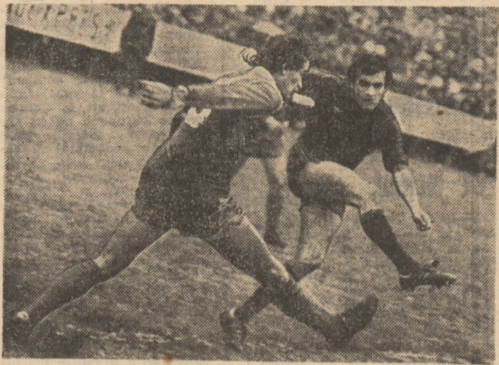
Cu toată opoziția lui Tică, Balint a reușit să șuteze puternic de la marginea careului de 16 m. Fază din meciul restanță Gloria — Steaua, disputat, miercuri, la Buzău.