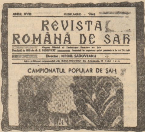
În facsimil, coperta unui număr al revistei noastre, de după 23 August 1944, anunșînd primul campionat popular de șah.