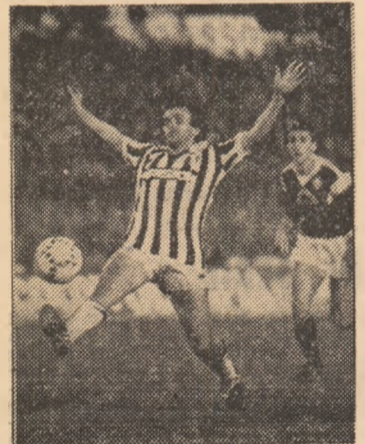
Desemnat de pe acum jucătorul nr. 1 al lumii, de revista „World Soccer”: Michel Platini...

R. D. GERMANIA (et. 12). Dynamo Berlin — Jena 1-1, Dynamo Dresden — Riesa 2-1, F.C. Karl Marx-Stadt — F.C. Magdeburg 0-2, Rostock — Aue 1-0. Lokomotive Leipzig — Union Berlin 2-1, Brandenburg — Vorkwärts Frankfurt/O. 1-1, Erfurt — Zwickau 3-0. Pe primele locuri: Dynamo Berlin 18 p, Dynamo