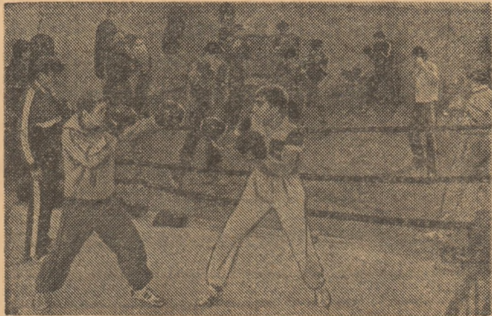
Un instantaneu în sala boxerilor de la Steaua. Pugiliștii militari pregătesc marea finală cu Dinamo, pentru titlul de echipă.