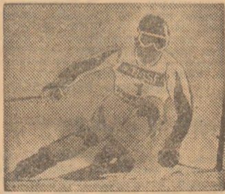
Forță, decizie, tehnicitate, hotărîre — iată argumentele principale ale lui Marc Girardelli, acum la startul noii ediții a „Cupei Mondiale”. Imagine dintr-un slalom uriaș desfășurat în decembrie trecut.

Ne-au sosit știri despre modalitățile de pregătire ale lui Marc Girardelli în timpul verii, pe care le considerăm interesante și, mai ales, demne de a fi urmate de toți cei care țintesc spre marea performanță în schiul alpin și nu numai. Bunăoară, laureatul de anul trecut, a considerat că o pregătire athletică la cel mai înalt nivel îi este neapărat necesară și, în consecință, a ajuns la 11,3 sec. pe 100 metri și la 7 metri la săritura în lungime... Extrem de exigent cu el însuși, știindu-și minusurile de la coborîre și-a cultivat, în principal, forța pentru a putea rezista cu bine șocurilor primite