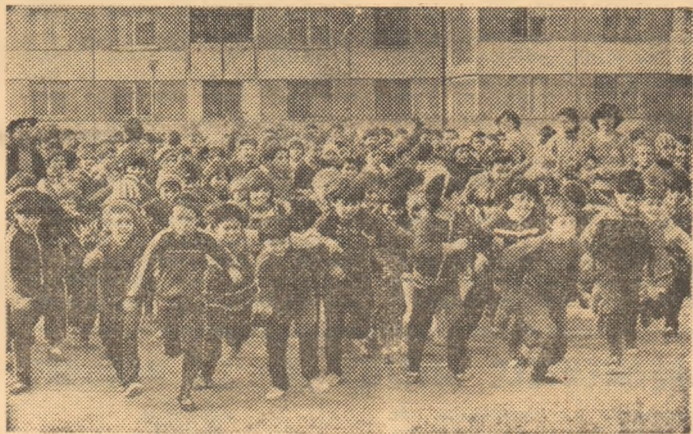
La întrecerile de cros organizate la școala nr. 133 din cartierul bucurestean Berceni participă toate clasele, adică peste 2000 de elevi...