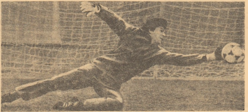
Intr-un interviu acordat agenției de știri Novosti, Rașid Dasaev (surprins într-o splendidă paradă, în imagine) declară: „Nu există gol imparabil!”

Acum, după Congresul F.I.F.A. de la Ciudad de Mexico, forul suprem a hotărît ca în meciurile din turneul final al C.M. să fie introdusă o nouă măsură. Formațiile care participă în grupe și apoi în fazele avansate ale competiției, pot schimba, în decursul mai multor jocuri, 10 fotbaliști de pe lista celor 22 de jucători și nu cinci, cîți erau admiși pînă acum (fieste, într-o singură partidă, numărul rămîne tot de doi). O măsură binevenită, care asigură mai multor jucători șansa de a intra în teren și a se... remarca.