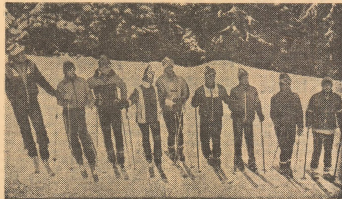
Gata de start, pe pîrtia Runo din Cîmpulung Moldovenesc.

Înțelegînd să răspundă și să încurajeze eforturile copiilor și tinerilor care, în paralel cu învățatura, își dedică o parte din timpul lor liber sportului, vizînd performanța, Consiliul Național al Organizației Pionierilor va organiza pentru cei mai talentați purtători ai „cravatei roșii cu tricolor”, o tabără a „speranțelor