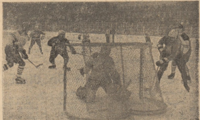
Fără fierbinte la poarta echipei poloneze, în partida de sîmbătă.

5-2 (2-1, 0-0, 3-1). Deși înțărîtă cu trei jucători aduși pentru meciurile de sîmbătă și duminică, formația poloneză nu a mai zburdat pe gheață, pasele lungi, de contraatac, eficiente (și indicate) în meciurile cu „tineretul” nu au mai dat roade. Pentru că hocheiștii noștri au făcut, în ansamblu, o partidă bună. În prima repriză oaspeții au dominat mai mult, dar au înscris o singură dată, prin Kwassgroch (min. 7), pentru că nu au mai avut precizie în șuturi, iar apărarea noastră,