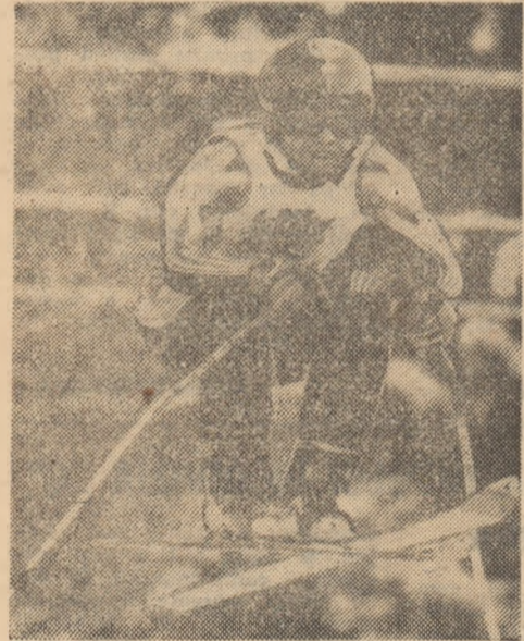
Wirnsberger — botîd pe pîrta de la Schladming!

● Turneul masculin de la Hamburg a fost cîștigat de Selecționata Cubei — 6 p. urmată de Polonia — 4 p. R.F. Germania — 2 p. Grecia — 0 p. La Shanghai, în meci feminin reprezentativa R.P. Chineze a dispus, în cel de-al doilea meci, de o selecționată mondială cu 3-2 (11, -12, 12, -10, 13).