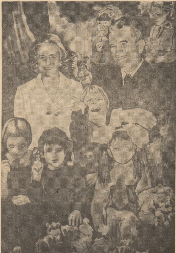
Pictură de Cornelia IONESCU