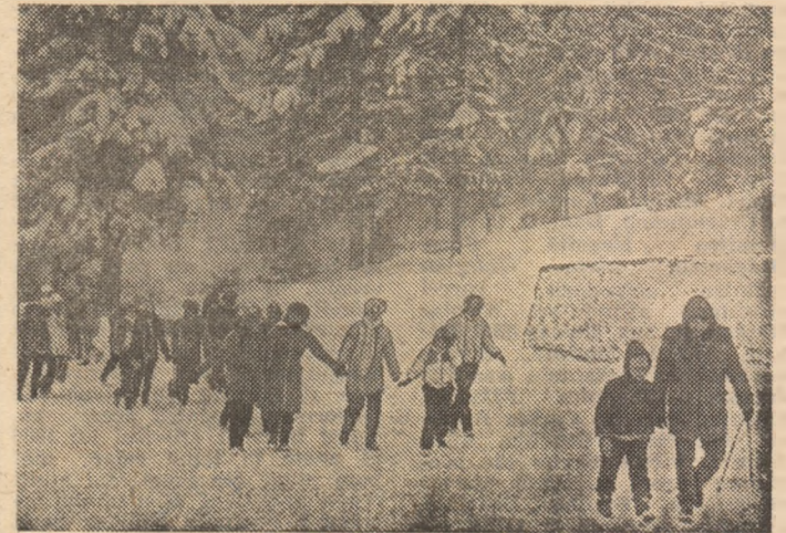
Drumeștiile, o permanentă a timpului liber petrecut în decorul alb al iernii.

În apropierea pîrțiilor de schi și săniuș, la cabane, oficiile județene de turism au amenajat centre speciale de închiriere a echipamentului sportiv pentru practicarea disciplinelor zăpezii și a drumețiilor montane.