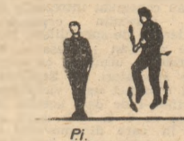
P.I. — stînd.

Alergare pe loc 15-20", în tempo viol cu lucru accentuat de brațe.