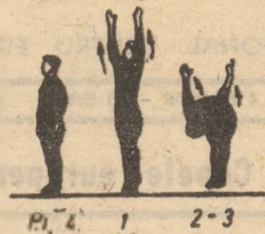
P.I. — stînd.

Ziua de apariție a rubricii „Zilnic, gimnastică la locul de muncă” — simbăto