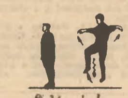
P.I. — stînd.

Ridicarea brațelor lateral și a piciorului stîng, oblic, înainte scuturat — inspirație. Revenirea — expirație.