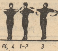
P.I. — stînd cu mîini la piept.

Arcuirea brațelor înapoi cu mîini la piept. Arcuirea mîinilor înapoi, întinse, cu îndoirea de genunchi concomitent.