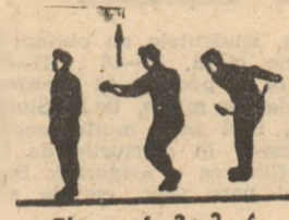
P.I. — stînd drept.

Indoirea genunchilor și brațelor înainte — elan (1). Săritură (împingerea rulată a piciorului) și balansarea brațelor înainte sus (2) revenire (3) și P.I. (4).