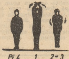
Poziția inițială — stînd.

Brațele lateral, sus pe virfuri — inspirație. Coborîrea brațelor lateral jos, revenire — călcă, aplecare înainte — expirație.