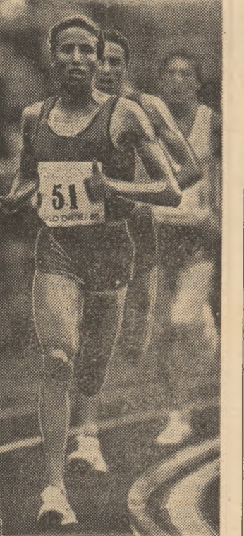
Said Aouita în 1985, spre noile sale recorduri mondiale, spre titlurile de cel mai bun performer al Africii și al Mediteranei, spre... 13:00,00 pe 5 000 metri?

La trei zile după ce Serghei Bubka realizase fantasticul record la prăjină, într-un alt concurs, tot în Franța, dar la Nisa, a fost spulberată bariera celor 3:30,00 pe 1500 m. Autorii acestei excelente performanțe au fost englezul STEVE CRAM (3:29,67) și marocanul Said Aouita (3:29,71); semifondistul african a fost întrecut pe ultimii metri al finisului. Vechiul record (3:30,77 din 1983) al britanicului Steve Ovett a fost, așadar, spulberat... Dar aproape de recorduri, Cram a mai reușit pînă la 4 august alte două: o milă - 3:46,31 la Oslo și 2 000 m - 4:51,39 la Budapesta, dar avea să-l piardă, totuși, pe cel de la 1 500 m în favoarea lui SAID AOUITA care în Berlinul Occidental, la 23 august, a încheiat distanța în 3:29,45. Există rezerve și disponibilități pentru rezultate sub 3:29,00 !! Și pentru că veni vorba de Aouita, campionul olimpic la 5 000 m, să spunem că el a obținut și recordul mondial la această probă cu 13:00,40, la Oslo, cu numai o... sutime mai bine decît englezul Moorcroft, el înfrîngîndu-se astfel rapid către un... sub 13 minute.