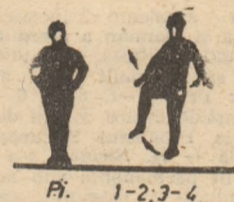
P.I. — stînd cu mîini pe sold.

Ridicarea oblic înainte — picior stîng, brațele lateral, rotări din labă și pumn de 2 ori interior și 2 ori exterior. Aceeași cu piciorul drept.