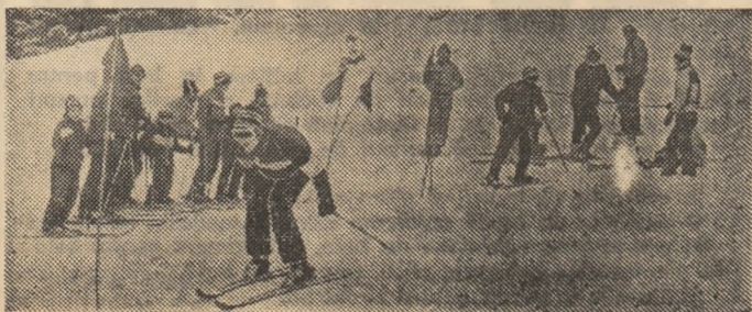
A nins! Pantele munșilor sînt luate cu asalt de iubitorii schiului, așa cum • demonstrează și fotografia surprinsă de fotoreporterul nostru Iorgu BANICA