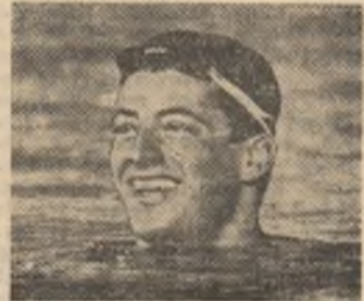
Matt Blondi, cel mai rapid înotător al lumii