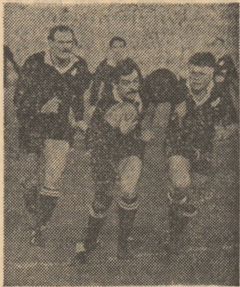
Totul pe cartea atacului! — Iată deviza rugbuiștilor neozelandezi (all blacks)

ma de a greși, că a apus epoca în care rugbuiul era doar „Turneul celor 5 națiuni“ sau 2-3 peripele pe an în Australia, Noua Zeelandă sau Argentina. De mai bine de un deceniu avem un tot mai puternic campionat european (sub egida F.I.R.A.), iar astăzi, cînd spunem „rugby“, spunem Argentina și Italia, România și U.R.S.S., Canada și S.U.A., Tunisia și Zimbabwe, Fidji și Japonia, numim, dacă vom continua enumerarea, peste 100 de țări (110 după unele surse).