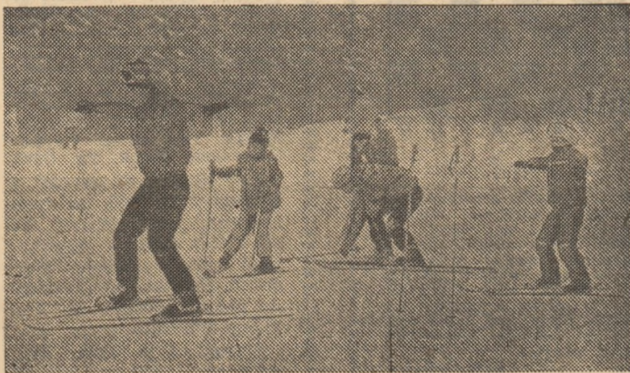
Primii pași în minunata lume a schiului, pași mărunți, marea pas spre fortificarea organismului, pe pîrtia de la Clăbucet

...Ningea ca-n povești peste Clăbucet. Prin perdeaua de omăt, pete multicolore coborau în viteză spre cabana de la „Clăbucet sosire”, deveneau, o clipă, în trecerea lor frumoașă, oameni, și dispăreau imediat înspre teleschi, în dansul lor de culori rupte parcă dintr-un tablou impresionist. Era o zi de vacanță, zi plină, cu pîrtia saturată de lume, mai ales elevi, schiuri, costume și clă-